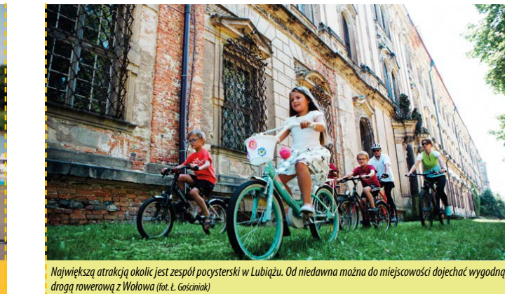
Największą atrakcją okolic jest zespół pałacowy w Lubiążu. Od niedawna można do miejscowości dojechać wygodną drogą rowerową z Wołowa

Wołów położony jest w Obniżeniu Wołowskim, nad rzeką Juszką, w malowniczej okolicy pomiędzy Parkiem Krajobrazowym Dolina Jezierzycy, Wysoczyzną Rościszawicką i Wzgórzami Struńskimi. W mieście krzyżują się drogi wojewódzkie Oleśnica - Trzebnica - Lubin, Strzegom - Wrzeszów i dalej do Rawicza oraz Zmigroda. Przez Wołów przebiega linia kolejowa. Miasto jest dobrze skomunikowane z Wrocławiem. Miasto zawiązało swą nazwę wielkim targom bydła, które odbywały się w średniowieczu na terenie Starożytności i Krzywego Wołowa, wsi będących początkiem dzisiejszego miasta. Pierwsze wzmianki nt. miasta datowane są na 1157 rok, kiedy książę wrocławski nakazał budowę drewnianego grodu na bagnistych terenach nad rzeką Juszką. Prawa miejskie Wołów otrzymał w 1285 r. Odbywały się tu sądy książęce, miasto posiadało własne władze i mennicę. W XVI-XVII w. Wołów stał się ośrodkiem szlacheckim i handlu, a większość mieszkańców przeszła na luteranizm. Po śmierci w 1675 r. ostatniego z rodu Piastów miasto znalazło się pod zwierzchnictwem Habsburgów, a w 1742 zostało włączone do Prus. Podczas II wojny światowej miasto zostało zniszczone w ok. 70%. Po wojnie do Wołowa przybyła ludność z Kresów Wschodnich, repatrianci oraz przesiedleńcy (np. Lemkowie).