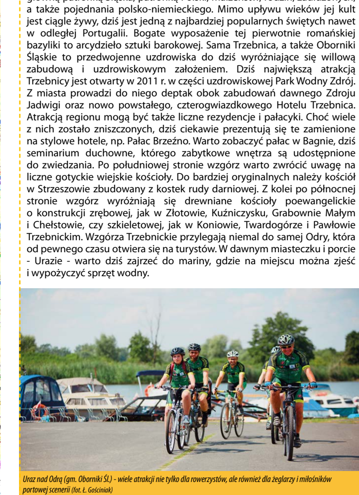
Uraz nad Odry (gm. Oborniki Śl.) - wiele atrakcji nie tylko dla rowerzystów, ale również dla żeglarzy i miłośników portawej sceny