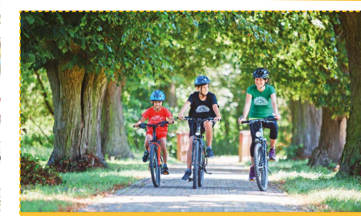
Droga rowerowa w Dobrzynie, widział pięknej alei lipowej

DOLNOŚLĄSKA KRAINA ROWEROWA to promocyjna nazwa obszaru północnej części Dolnego Śląska, gdzie szczególny nacisk kładzie się na rozwój oferty skierowanej do rowerzystów. Dolnośląska Kraina Rowerowa to trzy, dość od siebie różne pod względem krajobrazu, przyrody i rzeźby terenu, obszary geograficzne – Wzgórz Trzebnickie, Dolina Baryczy, Dolina Środkowej Odry. Każdy z nich oferuje inne atrakcje. Wzgórz Trzebnickie spragnionych fizycznego wysiłku, nizinne doliny rzek są idealne dla jazdy rekreacyjnej. Wszędzie znajdują się zadbane atrakcje turystyczne, przybiera wysokiej jakości dróg rowerowych, powstają usługi dedykowane rowerzystom.